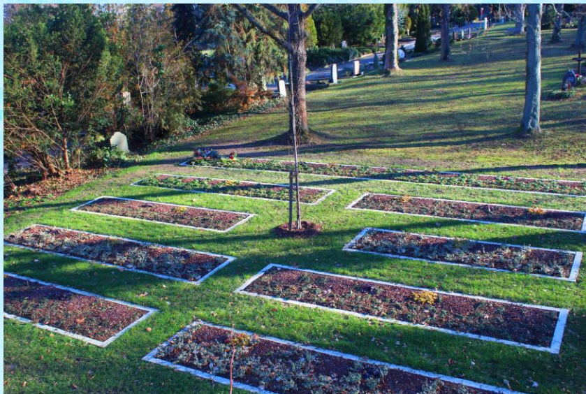
Neue Anlage für Urnenreihengräber auf dem Michaelisfriedhof

Für eine gepflegte Grabstelle mit einer Laufzeit von 20 Jahren, bepflanzt mit Bodendeckern und gepflegt durch den Friedhof, zahlen Sie eine einmalige Gebühr von 1.045 €.